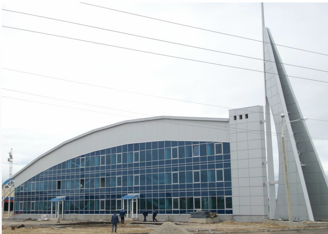
2011-2013 гг. Комплекс нефтеперерабатывающих заводов «ТАНЕКО» г. Нижнекамск. Устройство НВФ с облицовкой АКП «АЛКОТЕК» (тит. 72, 75, 112, 34.)