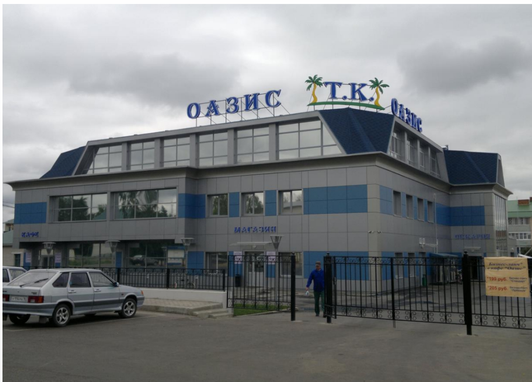
2012 Главное бюро медико-социальной экспертизы по РТ г. Казань Устройство НВФ с облицовкой АКП «АЛКОТЕК»